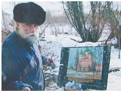
Художник Михаил Савицкий