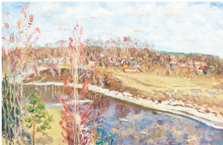
М. Савицкий. «Очапки». 2010 г.

Мемориальная выставка Михаила Савицкого будет работать в Центральном выставочном зале Союза художников до 29 марта.