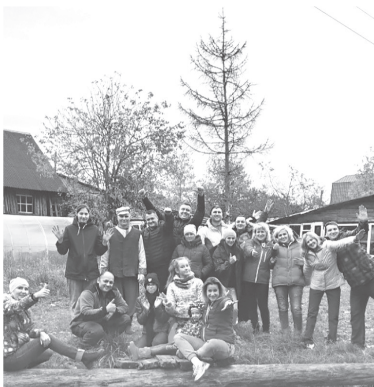
Участники слета предпринимателей Ярославского района

– Порой предприниматели берут разрешение на один вид торговли, а торгуют другим.